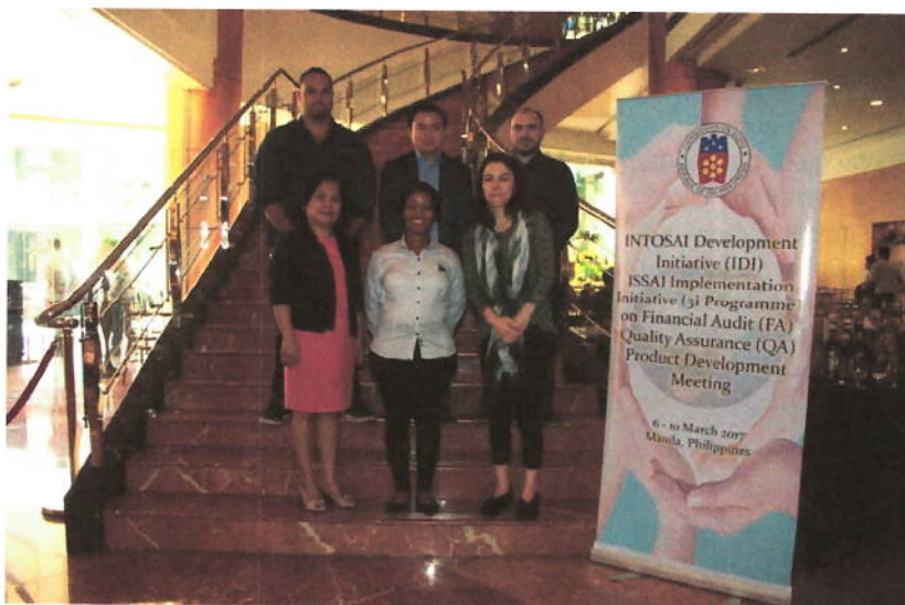
Personnes ressources à la réunion de développement des produits pour l'assurance de la qualité de l'audit financier à Manille en Philippines