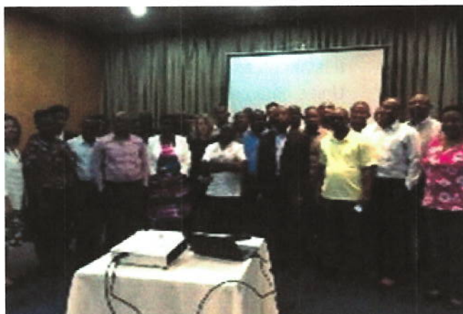
Participants à la réunion relative aux enseignements retenus et à l'atelier de planification pour la deuxième série d'audits pilotes-Programme relatif à l'audit de projets financés par des sources externes dans les secteurs de l'agriculture et de la sécurité alimentaire