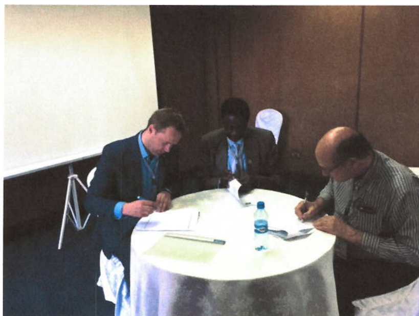
Un accord tripartite pour le soutien de l'ISC du Sud-Soudan a été signé avec des représentants de l'ISC Sud Soudan, AFROSAI-E et l'IDI

Ce bulletin vous a été envoyé par l'Initiative de Développement de l'INTOSAI. Vous pouvez gérer votre abonnement à partir des liens ci-dessous :