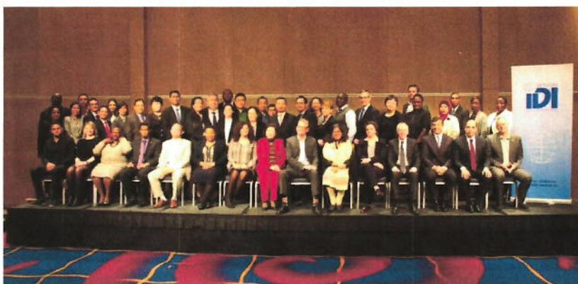
Participants à la réunion relative aux enseignements retenus sur "Cadres d'emprunts et de prêts pour la réalisation d'audits" à Oslo, en Norvège

Cette réunion a été organisée du 22 mai au 2 juin à Nay Pyi Taw, au Myanmar. Des personnes ressources issues des ISC d'Indonésie, du Pakistan, des Philippines, du Japon (ASOSAI) et de l'IDI œuvrent