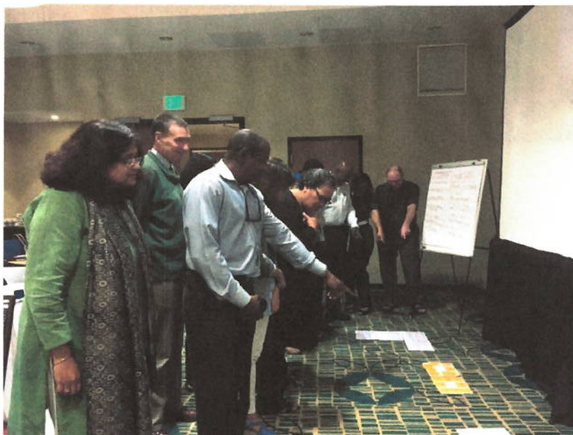
Equipe Mentor lors de la réunion de développement des produits sur le programme "Audit relatif aux objectifs de développement durable" à Kingston en Jamaïque

Lors de la réunion du Conseil de direction de l'AFROSAI-E organisée à Nairobi, au Kenya, l'IDI et l'AFROSAI-E ont signé un protocole d'entente avec l'ISC du Sud-Soudan afin de soutenir le renforcement de ses capacités dans le cadre du programme de soutien bilatéral de l'IDI. L'IDI a par ailleurs participé à une réunion avec le Vérificateur général et les hauts fonctionnaires de l'ISC d'Afghanistan, à Oslo le 24 avril 2017, afin de discuter des prochaines étapes tandis que le programme de soutien bilatéral de l'IDI dont a bénéficié l'ISC arrive à son terme.