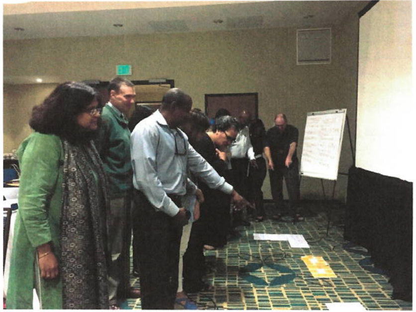
فريق عمل في اجتماع لتطوير المادة الخاصة ببرنامج رقابة أهداف التنمية المستدامة في كينغستون، جامايكا