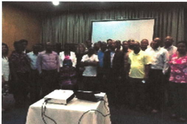
المشاركون في اجتماع الدروس المستفادة ورشة عمل لتخطيط الجولة الثانية من عمليات رقابة المشروع التجريبية الخاصة ببرنامج رقابة المشروعات المدعومة خارجياً في قطاعي الزراعة والأمن الغذائي

في اجتماع إدارة الأفروساي الناطقة بالإنجليزية المنعقد في نيروبي وكينيا، وقعت مبادرة تنمية الانتوساي والأفروساي الناطقة بالإنجليزية على مذكرة تفاهم مع الجهاز الأعلى للرقابة بجنوب السودان لدعم تنمية قدراته كجزء من برنامج الدعم الثنائي للمبادرة. كما اجتمعت مبادرة تنمية الانتوساي مع المراقب العام وكبار المسؤولين بالجهاز الأعلى للرقابة في أفغانستان في أوغلو في 25 أبريل 2017 نحو تنويع برنامج الدعم الثنائي لمبادرة تنمية الانتوساي للجهاز الأعلى للرقابة في أفغانستان ومناقشة سبل المضي قدماً