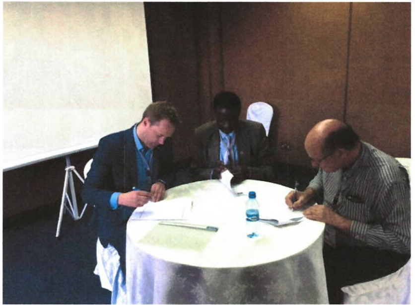
الاتفاق الثلاثي لدعم جهاز جنوب السودان الذي وقعه ممثلون من جهاز جنوب السودان، الأفرو ساي الإنكليزية والأي دي أي

تم إرسال هذه النشرة إليكم من قبل مبادرة الإنتوساي. يمكنكم إدارة اشتراككم عبر الروابط أدناه :