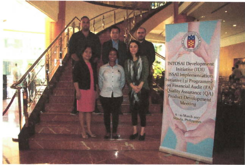
المشاركون في اجتماع تطوير منتج ضمان جودة الرقابة المالية في مانايلا بالفلبين

يعقد الاجتماع في الفترة من 22 مايو إلى 2 يونيو 2017 في ناي بي تاو، ميانمار. يعمل خبراء من الأجهزة العليا للرقابة في أندونيسيا وباكستان والفلبين واليابان (الأسوساي) ومبادرة تنمية الانتوساي على تطوير الدورات التدريبية الخاصة ببرنامج أخصائي التعلم متعدد الوسائل