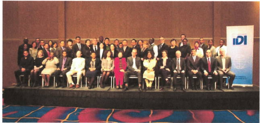
المشاركون في اجتماع الدروس المستفادة الخاصة ببرنامج رقابة أطر الإقراض والاقتراض في أوغلو، النرويج

دورة تدريبية أساسية وفي الفترة من 22 إلى 25 مايو 2017، عقدت دورة تدريبية أساسية لمنطقة الأفروساي الناطقة بالإنجليزية في بريثوريا. وحضرها 20 مشاركاً